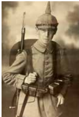
▲ Am Gothaer Herzog-Ernst-Seminar (jetzt gleichnamige Kooperative Gesamtschule) machte Brill von 1909 bis 1914 seine Ausbildung zum Volksschullehrer.